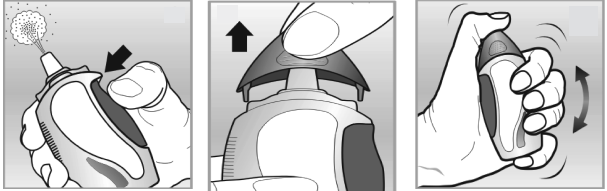
الشكل التوضيحي ١