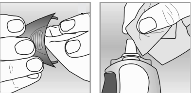
الشكل التوضيحي ٨