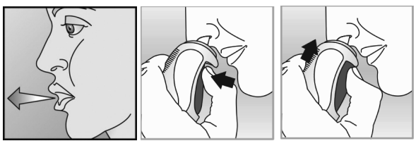
الشكل التوضيحي ٦

اتبع التعليمات الموضحة أدناه إذا كان لديك أي تساؤلات، يرجى استشارة مقدم الرعاية الصحية أو الصيدلي. قبل تناول جرعة من أفاميس بخاخ للأنف، يرجى المتخط برقف لتنظيف المنخرين. رُج القارورة جيدًا. ثم طبق الخطوات الثلاثة التالية: ضع الميسم، الضغط على الزر، تكرر العملية.